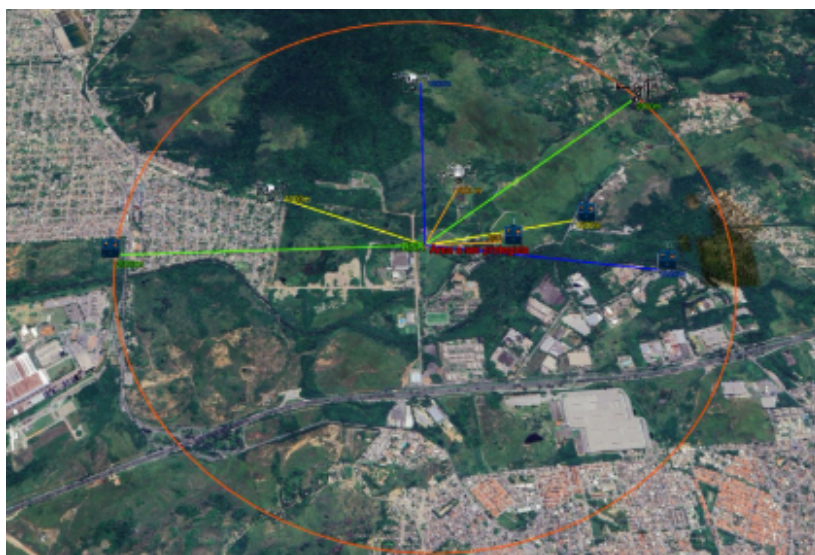
Croqui do cenário 2 do ITEM I. (a mesma dinâmica se repete para o ITEM II respeitando as distâncias a serem avaliadas).