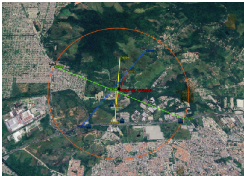
Croqui do cenário 1 do ITEM I. (a mesma dinâmica se repete para o ITEM II respeitando as distâncias a serem avaliadas).